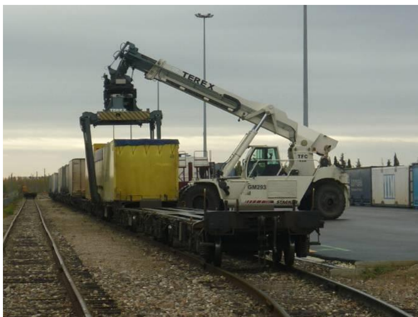
NOVATRANS Clesud Miramas

La qualité de la desserte routière des terminaux de transport combiné constitue de ce fait un élément clé du report modal.