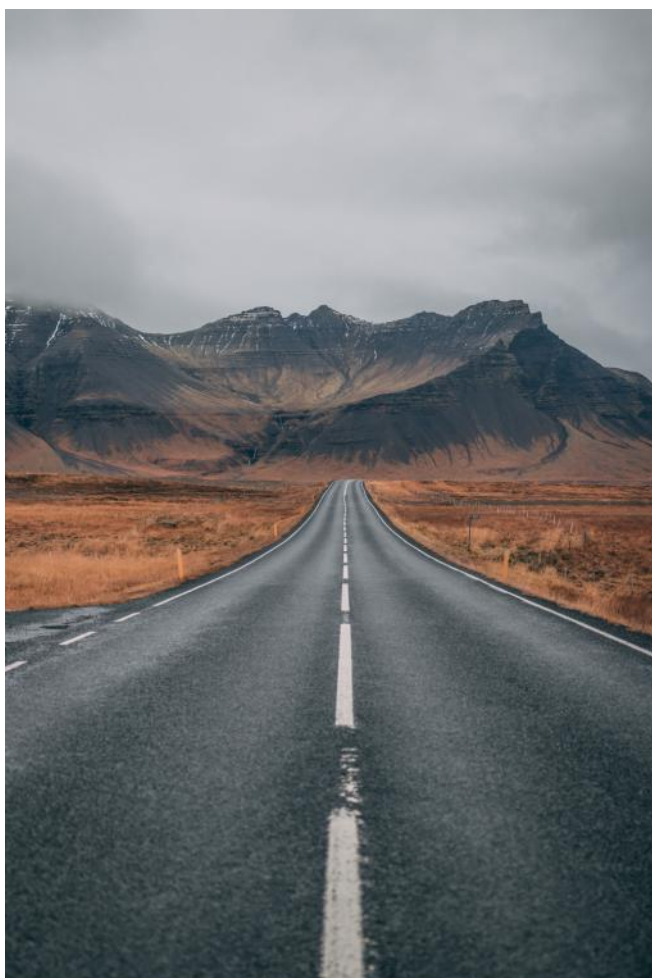
Visuel N°1 (Maximum 2 visuels)