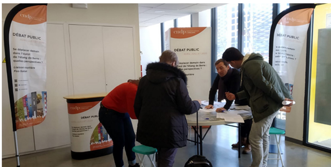
Le mardi 3 mars à la maison des services à Miramas

La Commission particulière qui anime le débat poursuit ses rencontres sur le territoire, pour comprendre les préoccupations de ses habitants et préparer le débat pour que tous puissent se faire entendre.