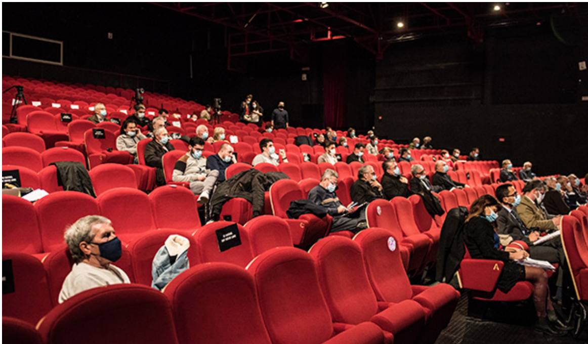
Plénière de clôture du débat, le 20 janvier 2021 à Fos-sur-Mer